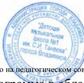
График образовательного процесса